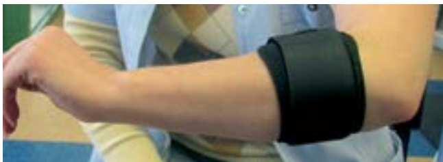
Ортез для лечения эпикондилита.

Для снижения напряжения следует при выполнении повседневных действий носить